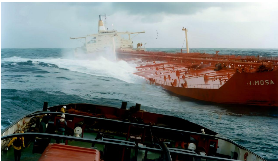
Wolraad Woltemade assisterar tankfartyget Mimosa utanför Eastern Cape Coast augusti 1991.