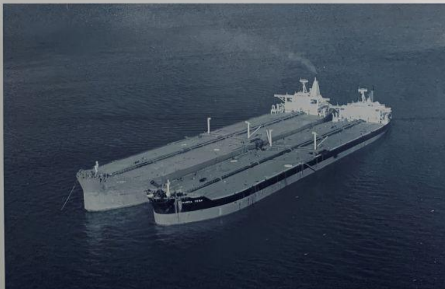
The two massive tankers, MIMOSA (left) and HANSA VEGA (right) lie side by side during the oil transfer operation in Algoa Bay.