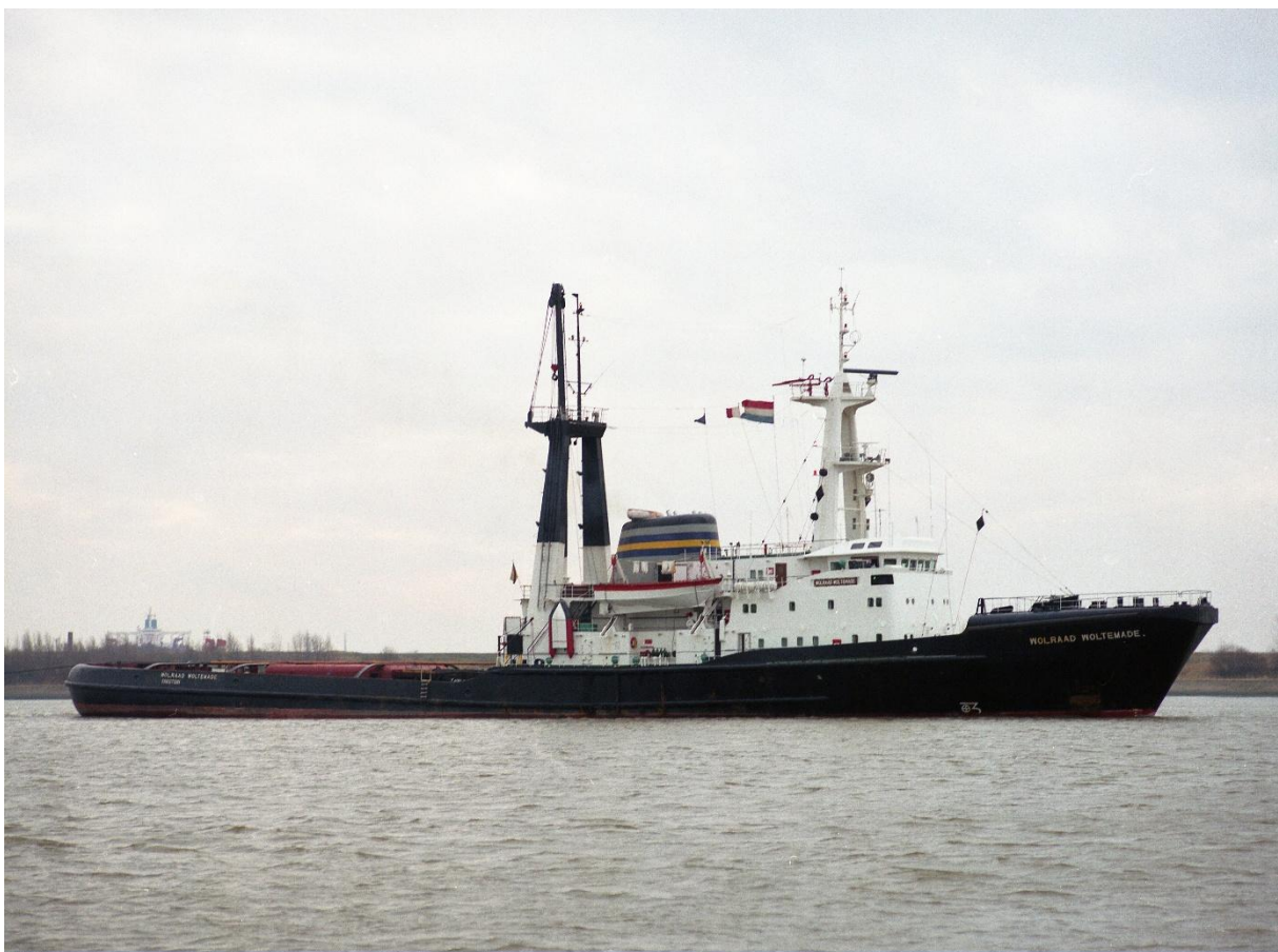
Wolraad Woltemade . Foto Shipspotting/I.Meyden

Många bogserfartyg har under årens lopp utnämnts till världens starkaste. Nu beror det ju lite på om man använder maskinstyrka eller "bollard pull" som måttenhet. Men två fartyg uppfyllde kraven med råge under tiden 1975 till 1990. Det var de sydafrikanska högsjöbogserarna John Ross och Wolraad Woltemade . Antagligen de vackraste fartyg i sitt slag som byggts.