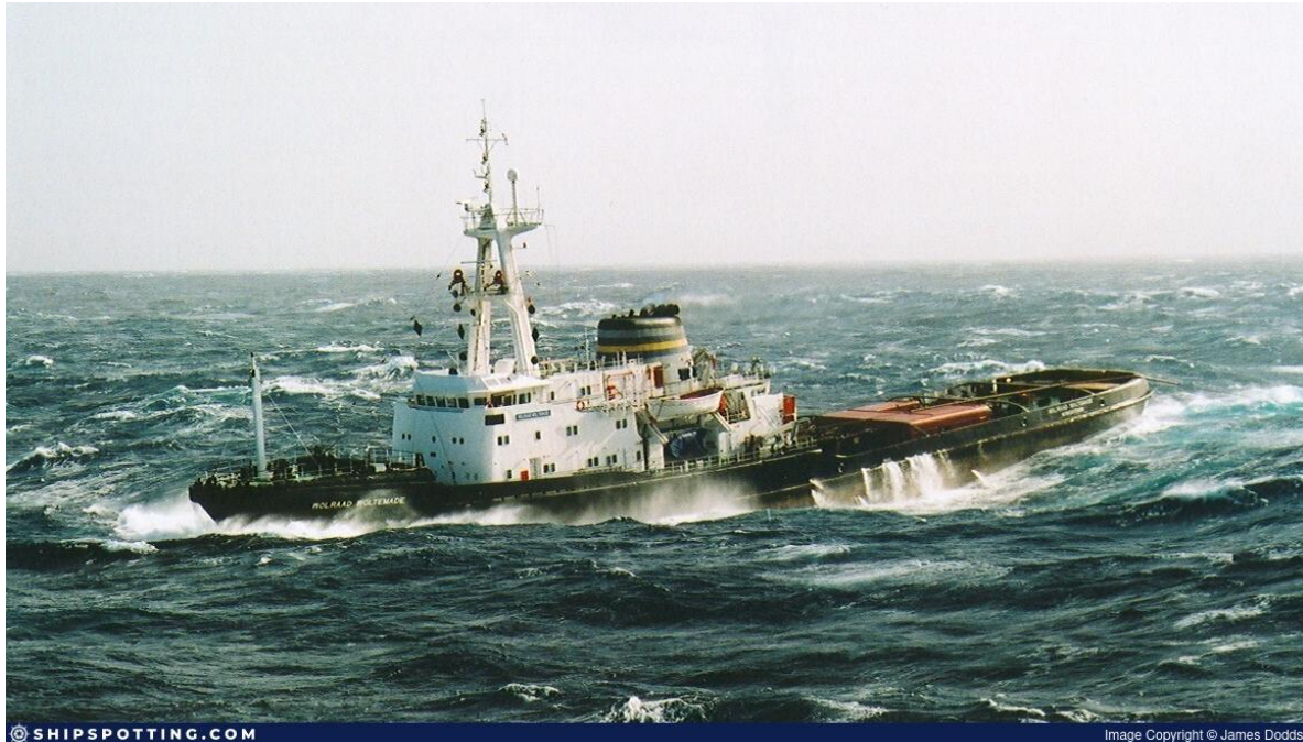
Wolraad Woltemade .

Ägare, manager och flagg skiftade under åren. Pentow Marine, där Safmarine var 50% ägare. Med tiden opererades båda fartygen av Pentow Marine. Holländska Smit Marine tog 2004 över Pentow Marine och bildade Smit Amandla som därefter drev de båda fartygen. Smit Amandla blev också det nya namnet på John Ross . Under åren skiftades flaggen från Sydafrikas till Panamas och därefter till Saint Vincent and the Grenadines.