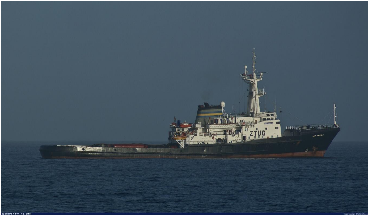
Smit Amandla (John Ross).

Sydafrika fick 1971 en påminnelse om de stora riskerna när ett tankfartyg, s/s Wafra , fick maskinhaveri och drev på land vid Cape Agulhas med ett oljespill på 40 000 ton som resultat. Trots att flera fartyg fanns på plats lyckades man inte att hantera situationen.